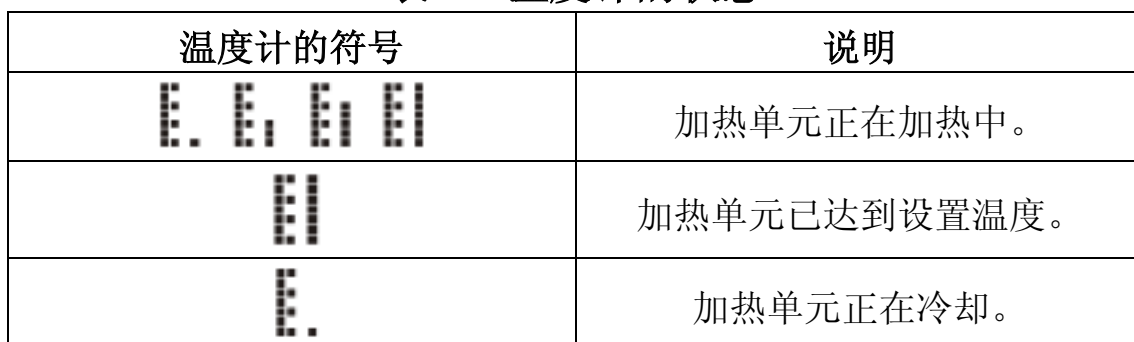
表 2 温度计的状态